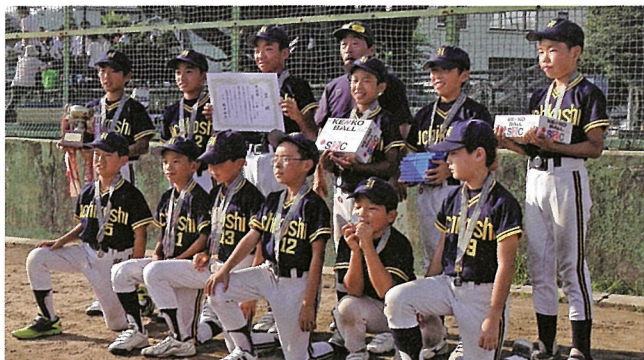
ソフトボール、フットベースボール 優勝チーム