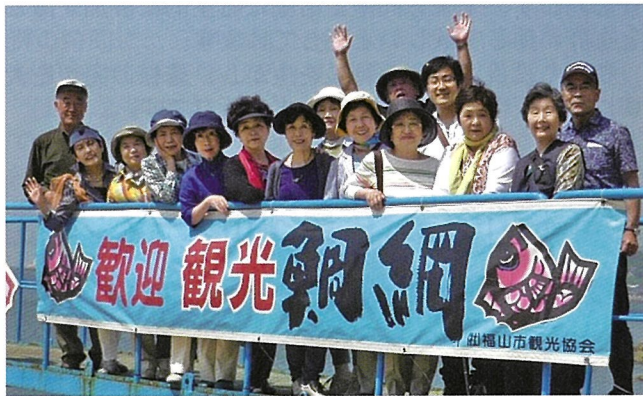
福山鞆の浦での吟行句会

去年は仙酔島に宿泊し、鞆の浦の鯛網漁の見学をしました。その他、世界無形文化遺産の壬生の花田植にも出かけました。10月は全国大会(一年に一度)が京都で開催されました。来年は東京の予定です。