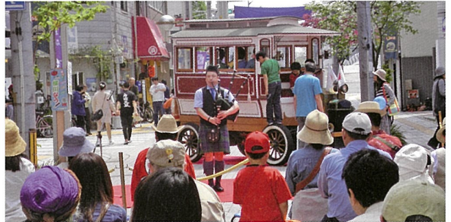
横川ふしぎ市・三篠公民館まつりでのボランティア

さらに本年度本校では、まちづくり「教育の絆」プロジェクトを立ち上げ、試験週間に実施する放課後学習会に、地域の方生徒たちの勉強のサポートをしています。