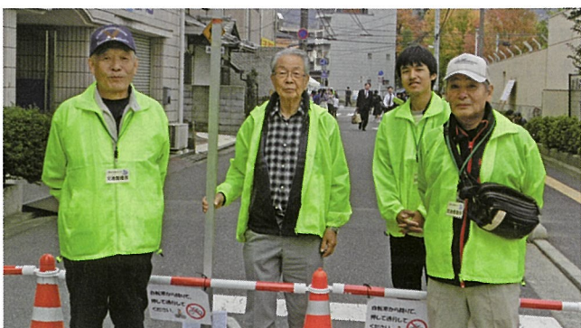
公民館まつり交通整理ボランティア